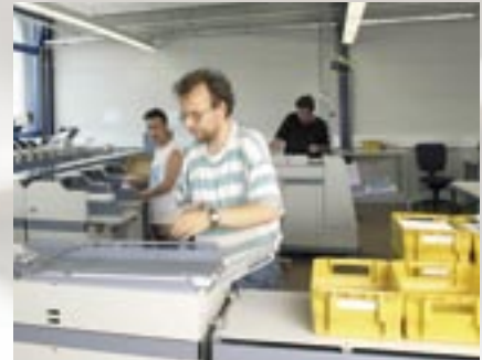
reha GmbH: 40 000 Kontoauszüge täglich

„Wenn ich vor Ort jemanden von der Holzer-Belegschaft brauche, dann ist er in einer Stunde da. Dabei interessiert nicht, ob es mitten in der Nacht, Wochenende, Feiertag oder sonst was ist. Holzer ist immer nur einen Anruf ent-